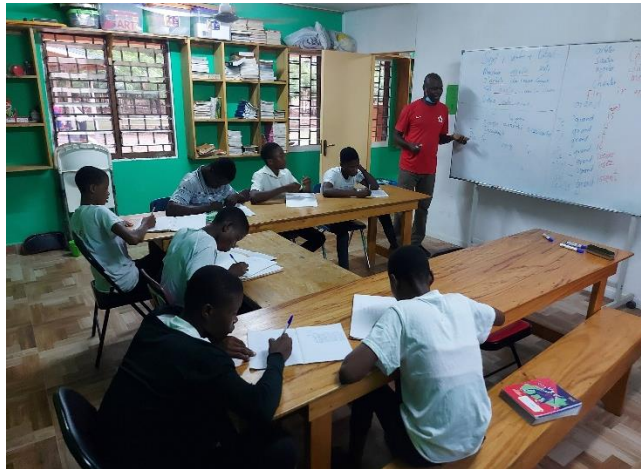
JHS studenten krijgen Franse les op ons centrum.

Het is alweer een hele tijd geleden, november 2021 om precies te zijn, dat twee Anansi studenten hun Basic Education Certificate Exam hebben gedaan ter afsluiting van Junior High School (JHS). Hoewel de uitslag in januari 2022 bekend had moeten zijn, kregen alle eindexamen kandidaten pas in maart hun resultaten. Diezelfde maand hoorden zij ook pas op welke openbare Senior High School (SHS) zij geplaatst waren om hun middelbaar onderwijs te vervolgen. De overgang van JHS naar SHS is dus niet echt een automatisme, na je examen heb je een lange wachttijd en tot op het laatste moment heb je geen idee op welke school je terecht komt.