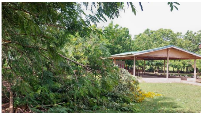
Omgevallen bomen op de Anansi compound

Nu de droogte van de harmattan voorbij is, zitten we sinds vorige maand volop in het regenseizoen. Heftige tropische stormen hebben inmiddels hun sporen achtergelaten met veel overstromingen, omgevallen bomen en kapotgeslagen elektriciteitskabels. Zo ook op onze Anansi compound. De tuinman is de afgelopen week druk in de weer geweest met het afzagen van grote, gevaarlijk loshangende takken. Inmiddels hebben we de schaapjes weer op het droge, zowel letterlijk als figuurlijk. Ons dorp lijkt veel op een kinderboerderij, waar o.a. kippen, kalkoenen, geiten en schapen overal vrij rondlopen.