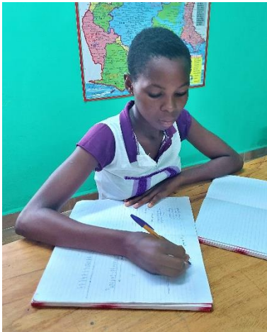
Tijd voor huiswerk!

Tot aan de Paasvakantie hebben we elke dag naschoolse lessen verzorgd bij Anansi YCC , daarna was er voor de jongeren een welverdiende vakantiestop. Iedereen was aan rust toe na een drukke eerste schooltermijn!