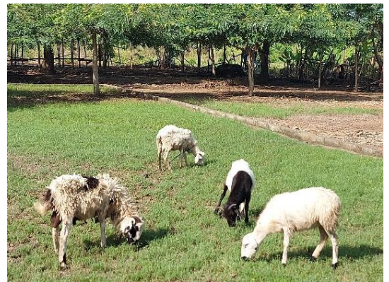
Na de storm komen de schapen en geiten weer grazen in onze tuin.